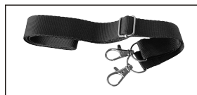
Correa para colgar