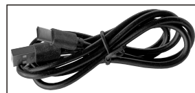
Cable de carga USB-C