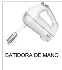
BATIDORA DE MANO