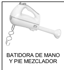
BATIDORA DE MANO Y PIE MEZCLADOR