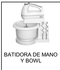
BATIDORA DE MANO Y BOWL