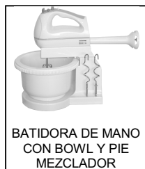
BATIDORA DE MANO CON BOWL Y PIE MEZCLADOR