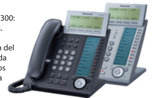
Teléfonos específicos IP de la serie KX-NT300

Los teléfonos IP de la serie KX-NT300 te llevarán a experimentar una nueva dimensión del sonido, una mayor productividad en las comunicaciones, conectividad de red de banda ancha y una mejor atención al cliente. Estos teléfonos IP te ofrecerán las ventajas de los avanzados sistemas de central IP KX-TDE, por lo que dispondrás de un acceso rápido a toda la variedad de aplicaciones y funciones de la central KX-TDE.