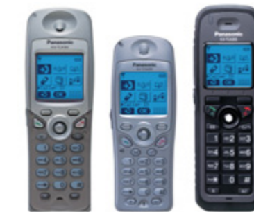
Teléfonos inalámbricos DECT de la serie KX-TCA

La central KX-TDE acepta movilidad inalámbrica gracias al sistema DECT multicelular integrado. Este sistema permite una entrega automática entre las células inalámbricas instaladas, mejorando la cobertura y proporcionando una verdadera movilidad de comunicación incluso en instalaciones muy grandes.