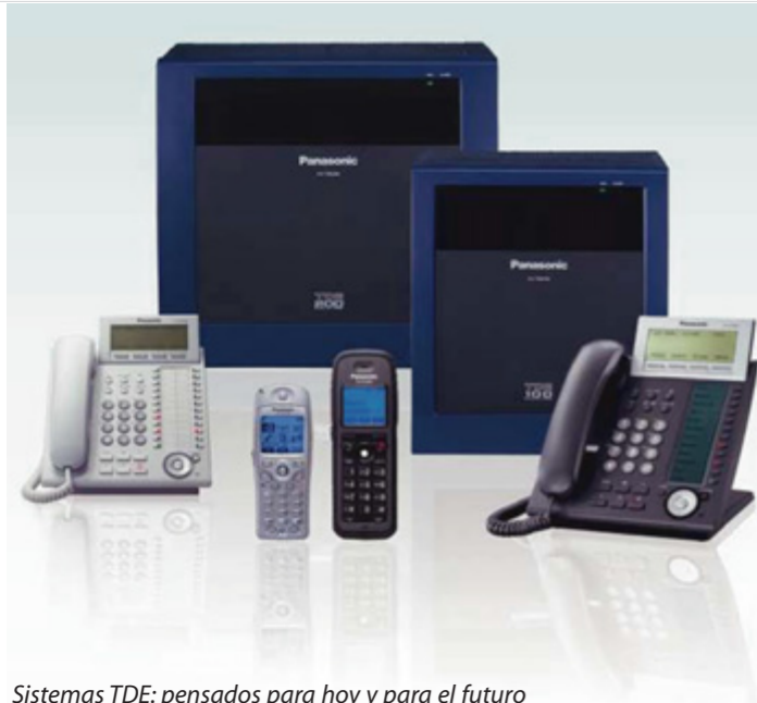
Sistemas TDE: pensados para hoy y para el futuro

Invertir en un sistema de telecomunicaciones requiere una previsión de las necesidades de comunicación de la empresa. Las empresas tienen que poder comunicarse eficazmente, pero también quieren estar seguras de que disponen de las mejores herramientas para gestionar las crecientes demandas de sus necesidades de comunicación futuras. Totalmente modulares y con la última tecnología SIP, las nuevas centrales IP KX-TDE son la plataforma de comunicación ideal para que los clientes puedan resolver todas las necesidades de telefonía de su empresa actuales y futuras puesto que disponen de telefonía IP.