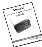
Manual del Usuario